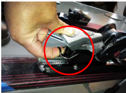
【スキービンディングの調整方法】